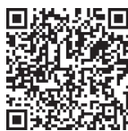
微课 什么是普通话

普通话是指以北京语音为标准音，以北方话为基础方言，以典范的现代白话文著作作为语法规范的现代汉民族的共同语。普通话是《中华人民共和国国家通用语言文字法》(以下简称《国家通用语言文字法》)规定的国家通用语言，也是联合国六种语言之一。普通话在中国台湾地区被称为“国语”，在新加坡、马来西亚被称为“华语”。