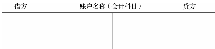
图 3-1 T 型账户

从图 3-1 可以看出,账户的基本格式分为借贷两方,分别用来记录会计要素的增加额和减少额。至于哪一方记增加,哪一方记减少,则取决于账户的性质和类别。由于会计是分期核算的,账户就会出现余额,余额按其隶属的期间不同,分为期初余额和期末余额。因此,通过账户的记录,可以提供在某一期间某一核算项目的期初余额、本期增加额、本期减少额和期末余额等四项会计核算指标。