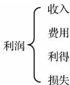
图 1-3 利润的组成