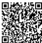
微课 人力资源管理的概念

(2) 管理形式上的区别。传统人事管理属于静态管理,也就是说,当一名员工进入一个单位,经过人事部门必要的培训后,被安排到一个岗位,完全由员工被动地工作,自然发展;