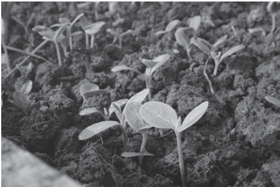
图 1-10 雨水育苗