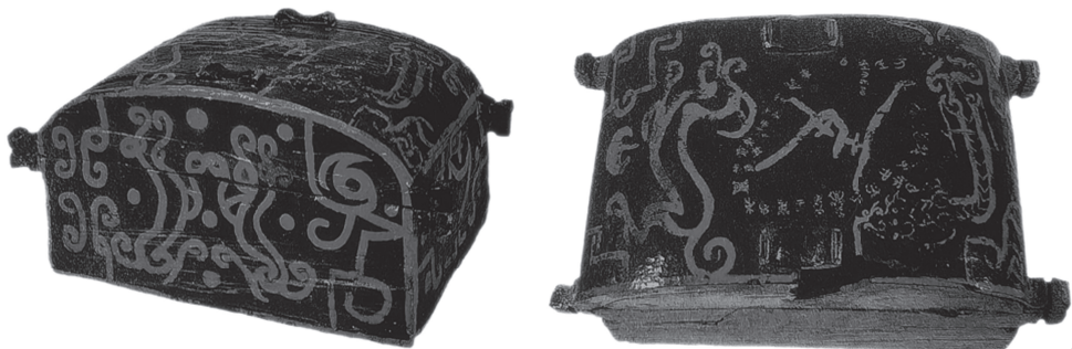
图 1-9 曾乙侯墓出土的二十八星宿衣箱

中国古人很早就重视星象观测，用以指导农业生产。在中国古人的观念中，紫微垣位于天的中心，其他区域是二十八星宿。二十八星宿的东、南、西、北四个方位分为四个大组，分别与四种颜色、四种动物一一对应，被称作青龙、玄武、白虎、朱雀。曾乙侯墓出土有二十八星宿衣箱，证明了2500多年前中国就有了完整的二十八星宿体系。