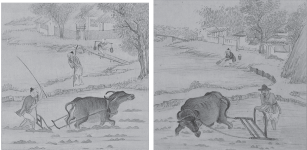
图 1-13 清·《绵亿耕织图册》——耕地、秒 ①

在中国北方，随着气温回升，冬小麦开始萌发新叶片，麦田由黄转绿，正如农谚所说，“惊蛰麦返青”。对返青冬小麦要尽快开展中耕、追肥、浇水等工作。西北地区播种春麦，华北地区耕地施肥。在中国南方，油菜要施苔肥，早稻要育秧。长江三角洲地区，各种农作物如油菜开花，小麦开始拔节拔。西南地区，追施穗肥，防病虫害。华南地区，播种早稻，茶树催芽。