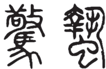
图 1-11 “惊”“蛰”的篆书