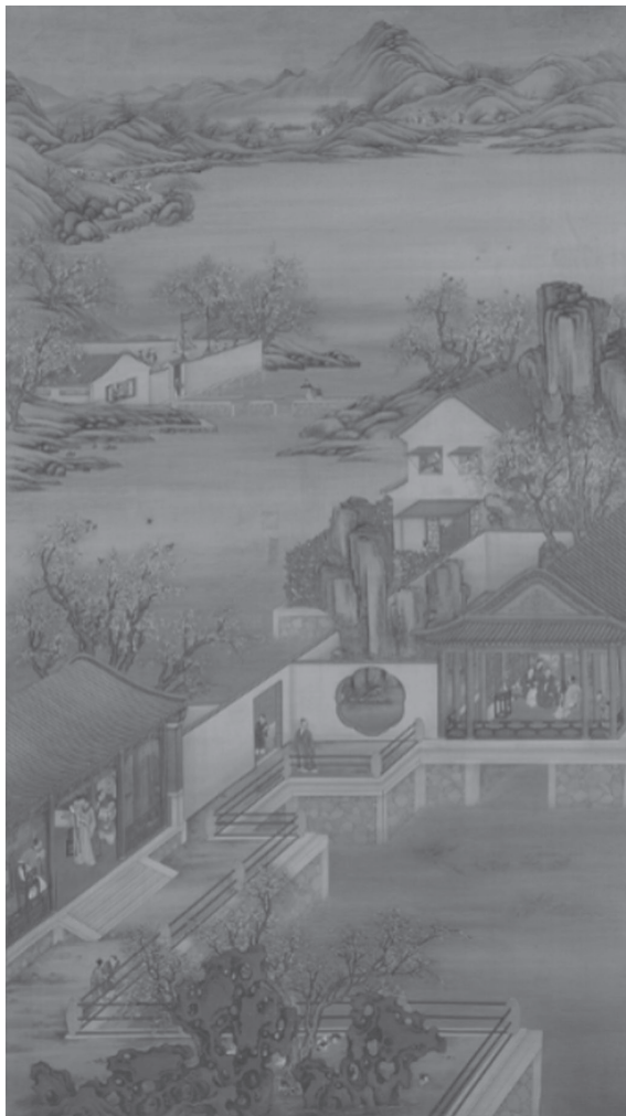
图 1-12 清·《雍正十二月行乐图》轴——三月赏桃