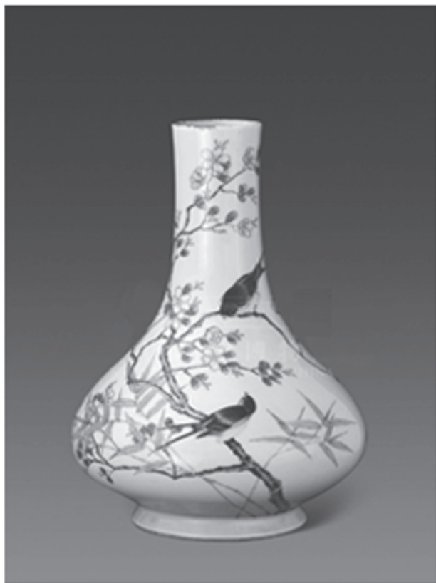
图 1-1 清·粉彩杏林春燕纹瓶 ①

立春在古时的中国被视为春季的开始；农历正月、二月、三月在民间被视为春季；在气候学中，连续 5 天在 10 摄氏度至 22 摄氏度的时间段为春季（或者秋季），从立春到立夏这段时间都被称为春天。