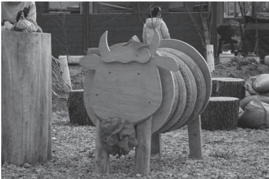
图 1-6 春牛

鞭春牛是立春时民间迎春的风俗习惯。鞭春牛象征着春耕的开始，寓意打去一年的晦气，预示丰收，迎来好运。学生可以体验鞭春牛，许愿新的一年学习进步、健康成长。