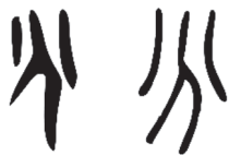
图 1-15 “分”的甲骨文、篆书

在 24 个节气之中，春分是第一个带“分”的节气。分，有分开、一半之意。分的甲骨文、篆书看起来都像用一把刀将物体一分为二。《说文解字》中说：分，“别也。从八从刀，刀以分别物也”。