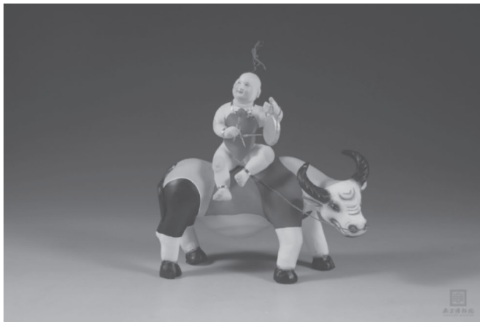
图 1-5 当代喻湘莲惠山泥人“五色春牛”