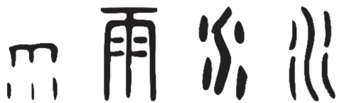
图 1-7 “雨”“水”的甲骨文、篆书（图片来源：Chinese Etymology 字源）

在 24 个节气之中，雨水是第一个带“雨”的节气。“雨”的甲骨文看起来像屋檐正在滴水。“水”的甲骨文看起来像弯弯曲曲的流水，有人说两边的点象征支流，有人说两边的点象征小水花。《说文解字》中说：“水，准也。北方之行。像众水并流，中有微阳之气也。凡水之属皆从水。”“水准”即“水平”，是古时测量水平面的用具。