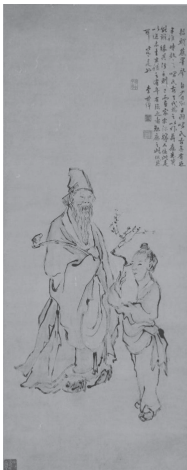
图 1-4 明·李世倬绘《指画岁朝图》轴 ②

俗语有云：“春为岁首。”立春从秦朝开始便被视为春季的开始。“岁朝春”又被称作“压岁春”，说的是如果农历正月初一恰逢立春节气，是当年必有好收成的预兆。上海农谚说：“百年难遇岁朝春，农民喜庆好收成。”《指画岁朝图》轴见图 1-4。