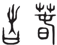
图 1-2 “春”的甲骨文、篆书

春象征着冬去春来、万物复苏。“春”的甲骨文看起来像新芽破土而出。汉许慎在《说文解字》中说：“春，推也。从艸从日，艸春时生也。”“艸”同“草”，“中”像种子破土萌发。汉刘熙《释名》中说：“春，蠢也，动而生也。”意思是春天来了，虫类蠢蠢而动。