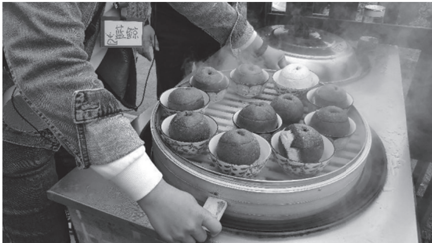
图 1-14 蒸梨