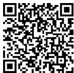
资料 蒙台梭利简介

20世纪以后,全世界范围内对幼儿教育的重视程度普遍增强,幼儿教育得到前所未有的高速发展。发展心理学和教育心理学的发展不断影响人们对幼儿教育的理解,行为主义、认知主义、人本主